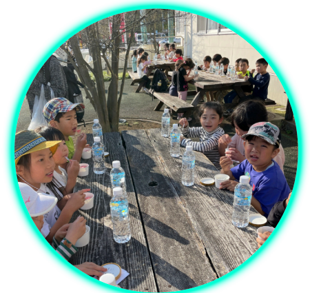
ジェラートを食べて帰ろうね♪